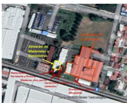
Imagen obtenida del Informe de Auditoría AI-2022-Inf-02. Marzo de 2022.

Dónde está ubicado el almacén central, espacialmente está en la sede de Pavas, está es una toma que hicieron con dron. Esta imagen fue tomada del informe de la Auditoría.